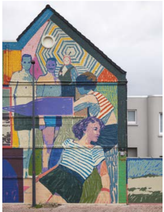
Pat Perry pour The Crystal Ship 2023 à Ostende

Bjorn Van Poucke bjorn@allaboutthings.be 0485/17.39.39