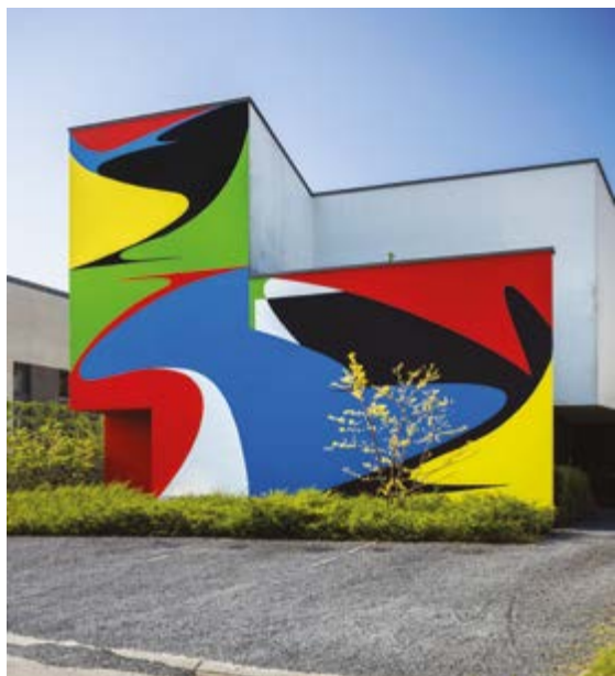
"Elasticity & tenderness" van Elian Chali, 2023.

Het PARCOURS Street Art is een project van de Cultuur Dienst van de Stad Brussel en bevordert hedendaagse kunst in de openbare ruimte op het grondgebied van de Stad Brussel.