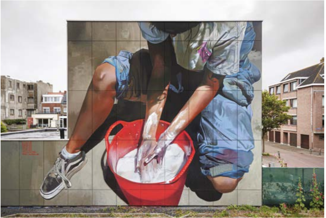
Case Maclaim voor The Crystal Ship 2020 in Oostende